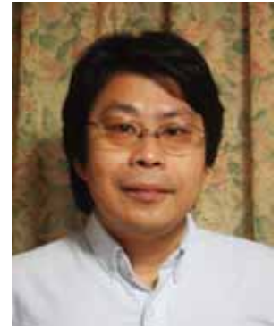
白い渚で待ってます。

「海苔のふるさと」と呼ばれる大田区大森に、「大森ふるさとの浜辺公園」が本年4月に開園しました。私は、その浜辺公園に来年の4月開館を予定している、資料館の開設準備に携わっています。資料館は江戸前の海苔作りの歩みや、海苔産業がこの浜から各地へ伝えられたことなどを、地域の人々が主体となって伝える施設です。この、浜辺公園と資料館という取り合わせを、ぜひ活かしていきたいですね。生活から隔絶していた東京湾が身近となった浜辺と資料館が、江戸前ESDの活動に触発されて、発見と感動の場となっていくのが楽しみです。浜辺ができて元気になった元漁業者、浜辺で子供を遊ばせたい親たち、浜辺で発見学習をしたい小学教員などなど、様々な人々が注目しています。