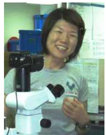
Take it easy ;)

東京湾は、資本主義の発展とともに栄えた世界有数の場所です。昔は殺風景だった大学近くの運河沿いの風景も、いつの間にかとても都会的になりました。一方では、今日も太陽光を浴びて元気に増殖する植物プランクトンはいるし、ボラは跳ねるし、イッカククモガニは泳ぐし、ウミネコは何かをねらっています。江戸前ESDによる体験を通して、この東京湾に生息する生物と私たちとの関係を考え、その発想をみんなで共有することができると期待しています。