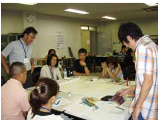
議論が白熱しています。手前右が筆者。

江戸前ESDは、試行錯誤で軌道修正を重ねながら、持続可能な東京湾をめざす循環を地域で生み出そうとしています。そのためには、さまざまな視点やご意見、すなわち、多くの方々の参加が不可欠です。