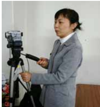
授業の映像記録をとる筆者。

発行 江戸前ESD瓦版編集委員会 〒108-8477 東京都港区港南4-5-7 東京海洋大学 海洋科学部 江戸前ESD事務局内 電話/FAX 03-5463-0574 電子メール edomae@kaiyodai.ac.jp